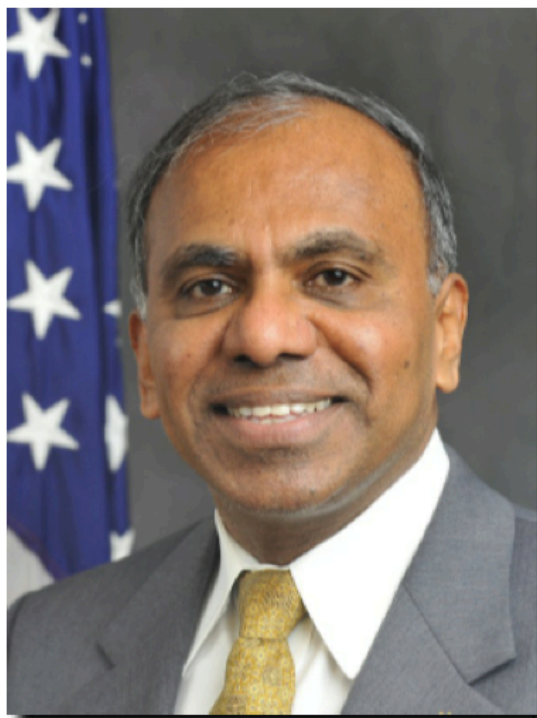
Dr. Subra Suresh Director The National Science Foundation